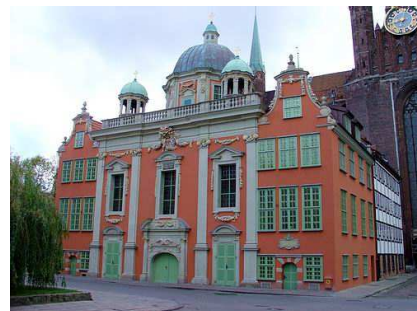
La Chapelle Royale

Pour copie certifiée conforme à l'original par nous Maire de Gençay le dix novembre mil huit cent trente huit. signé AGIER.