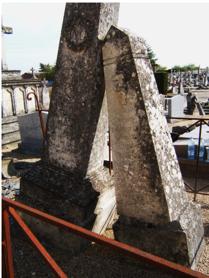
Cimetière de Gençay Sépultures GRESSER

Ainsi, à quelques années d'écart, l'histoire européenne allait faire se croiser deux destins, celui de deux officiers, l'un, français, officier de l'armée française occupant Dantzig et qui allait se marier dans cette ville, l'autre, polonais, de Dantzig, pays occupé par la Russie, contraint à l'exil à cause de la repression, et venu se marier à Gençay, Tous les deux finiront leur vie à Gençay et seront inhumés, côte à côte, avec leur épouse, dans le cimetière de la commune.