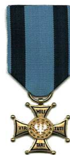
La Croix d'Or Virtumilitari

La Croix d'Or Virtutimilitari en latin « pour le courage militaire » est la plus haute décoration militaire polonaise. Elle récompense la bravoure face à l'ennemi. Elle fut créée le 22 juin 1792 par le roi de Pologne, Stanislas Auguste Poniatowski.