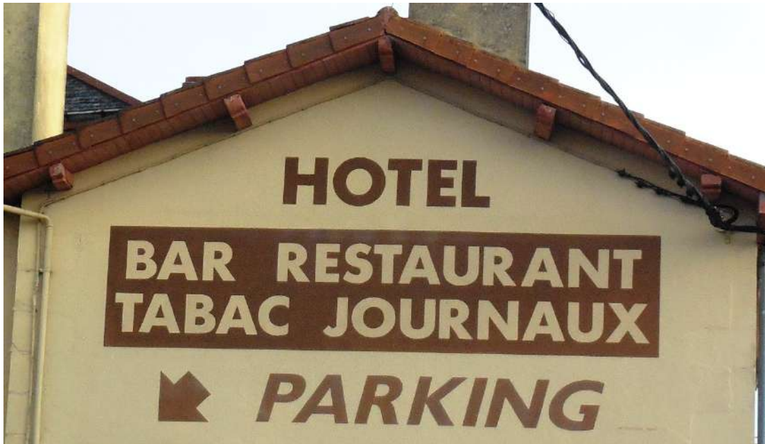
Lettres sur mur peint (Poitiers)