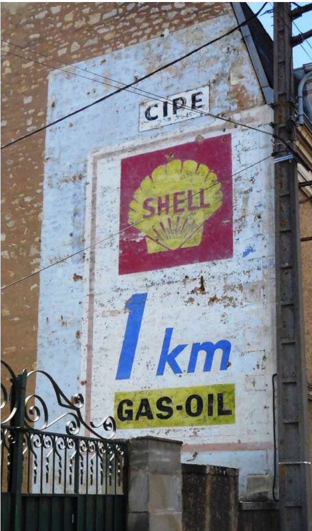
Peinture murale publicitaire (Poitiers)