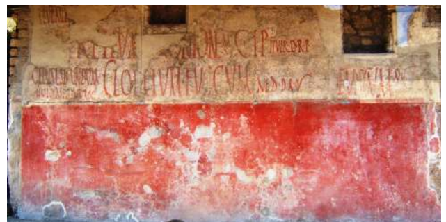
Enseigne d'un marchand d'huile à Pompéï

Dossier établi par Jean-Jacques et Pierre CHEVRIER, décembre 2016.