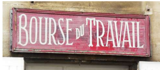
Lettres sur panneau de bois (Poitiers)