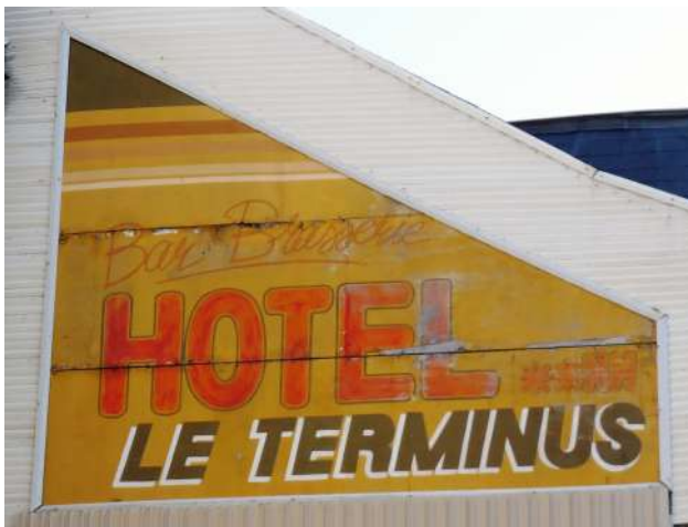
Publicité sur panneau de bois (Poitiers)