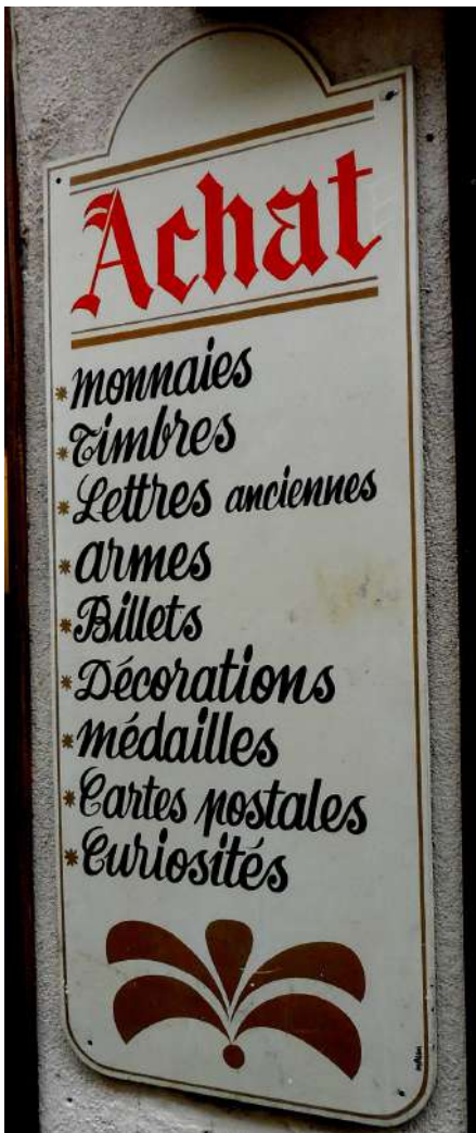
Différentes activités Poitiers