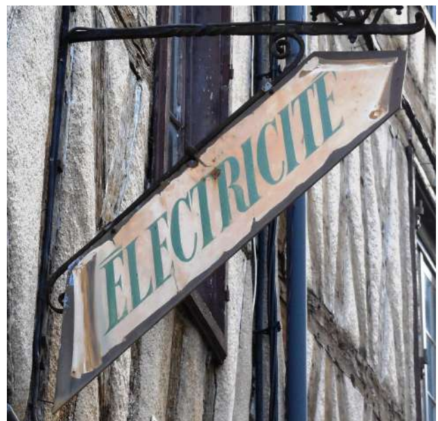
Lettres sur panneau métallique (Poitiers)