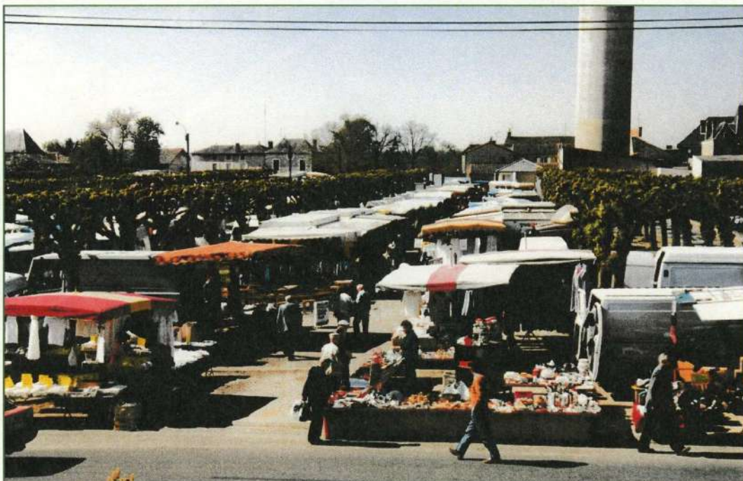
Champ de foire - 1997