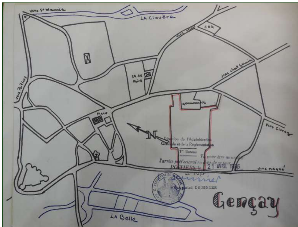
Ce plan sommaire de Gençay (1966), accompagnant le dossier du lotissement, et visé par le Préfet DEUGNIER en avril 1966, est très intéressant: 1 -il signale (en rouge) le périmètre concerné par le futur lotissement, où on remarque que les voies d'accès par la route de Civray, au nord et au sud n'existent pas encore; 2 -Il mentionne les halles de foire: veaux et volailles; 3 -Le site du CEG est également porté; 4 -Le réseau des bras de La Belle, où il était à l'époque question d'aménager un plan d'eau (environ 2 Ha), est également mis en valeur.

Gençay; de plus, il est mentionné que ces demandes ont été faites « avant même toute publicité » (CM.).