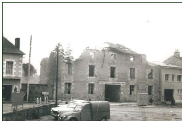
Démolition de l'ancienne gendarmerie

L'adjudication des travaux de construction de la nouvelle gendarmerie a eu lieu le 30 - 07-1963; tout le monde se félicite avec les gendarmes, que la brigade quitte ses locaux sombres et vétustes. La partie bureaux est livrée durant l'hiver 1963-64, et les logements, construits par l'entreprise TAM de Joussé, à l'été 1964. A la suite, la démolition de l'ancienne gendarmerie permettra d'ouvrir la nouvelle rue, dite « du 8 Mai », qui permettra l'accès aux nouveaux lotissements.