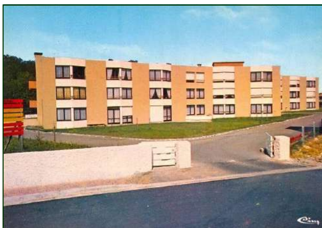
Le Foyer logement lors de sa réalisation

La commission décide d'adopter le plan sommaire d'urbanisme de la commune de Gençay.