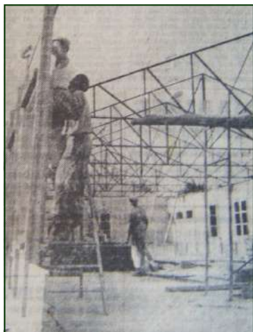
Les travaux de construction de la Maison Familiale de filles 1959

Note: Nous n'avons pas pour l'instant étudié le cas de la Maison Familiale des garçons, rue de Civray.