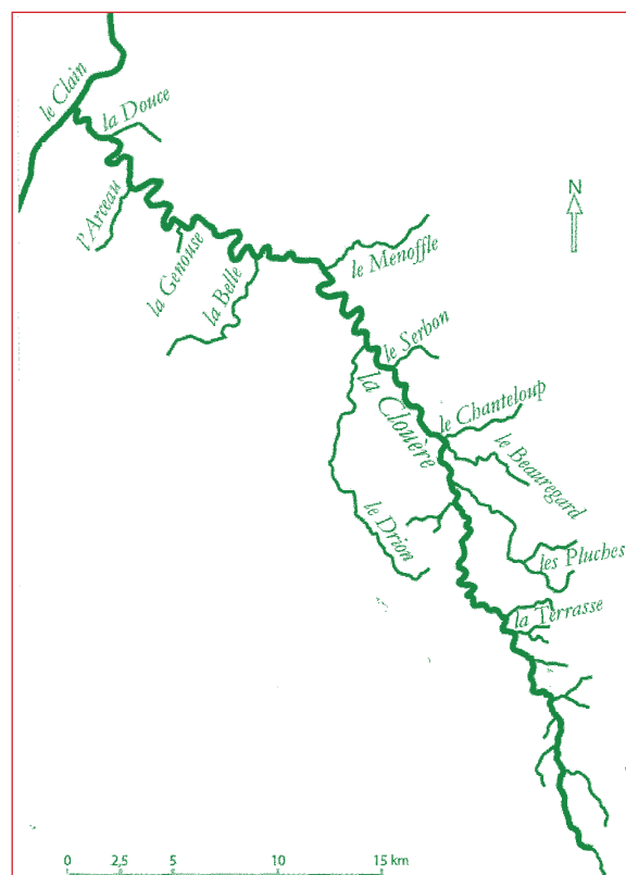
La Clouère et ses affluents

Les Conservatoires d'Espaces Naturels (CEN) sont des associations relevant de la Loi 1901, agréés par l'Etat et leur Région. Ils ont pour objectif de préserver le patrimoine naturel et ciblent leur action sur des sites remarquables. Entre 2000 et 2020 la stratégie du CEN Nouvelle-Aquitaine s'est concentrée sur certains milieux à forte biodiversité : carrière, landes, zones humides... puis depuis peu, l'association a élargi ses actions aux bocages puisque ceux-ci sont de plus en plus identifiés comme des vecteurs de biodiversité. La stratégie évolue donc en fonction des enjeux environnementaux. Considérant que seule la maîtrise foncière permet la pérennité des actions, les CEN développent une stratégie foncière privilégiant l'acquisition ; pour autant elle n'est pas la seule alternative. Chaque contexte doit