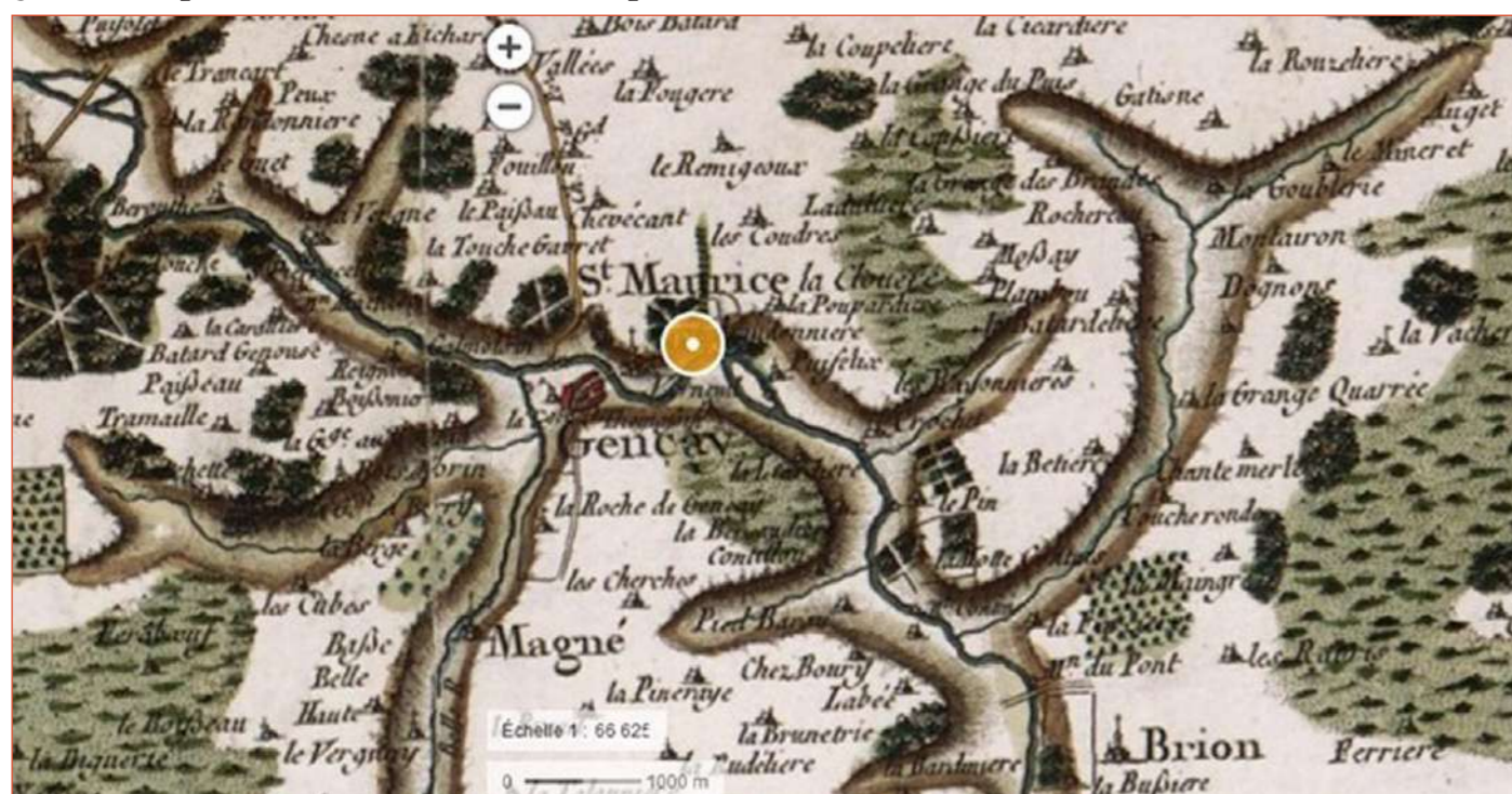
La Ménéoffe sur la Carte de Cassini (XVIII siècle)

Le fonctionnement de la Ménéoffe était fortement perturbé en raison d'un étang construit sans autorisation dans les années 70. Le cours d'eau avait alors été déplacé en bord de parcelle, « perché » à l'image de nombreux biefs de moulin ; une buse en détournait le débit à son profit. Les nouveaux propriétaires ont découvert le caractère illicite de l'ouvrage et constaté que l'étang parvenait difficilement à retenir l'eau. Ils ont conduit une étude