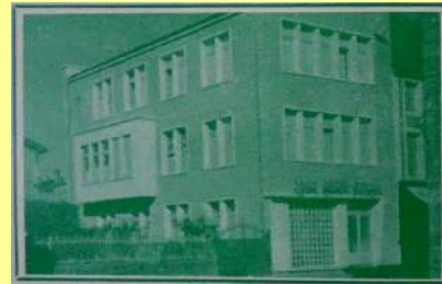
Clinique-Maternité « La Roseraie » -1956

NAÎTRE à GENÇAY LA MATERNITÉ « LA ROSERAIE » (1956-1975)